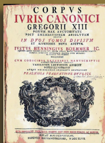
Corpus Iuris Canonici Gregorii XIII Pontif. Max. auctoritate post emendationem absolutam editum, Augsburg 1747

Il corso è rivolto agli studenti delle Facoltà ecclesiastiche di diritto canonico e delle Facoltà di Giurisprudenza che possiedono una conoscenza sufficiente in materia di Storia del diritto canonico e che intendono completare e migliorare la loro preparazione nella disciplina, soprattutto nella ricerca dottorale o nella tesi di laurea.